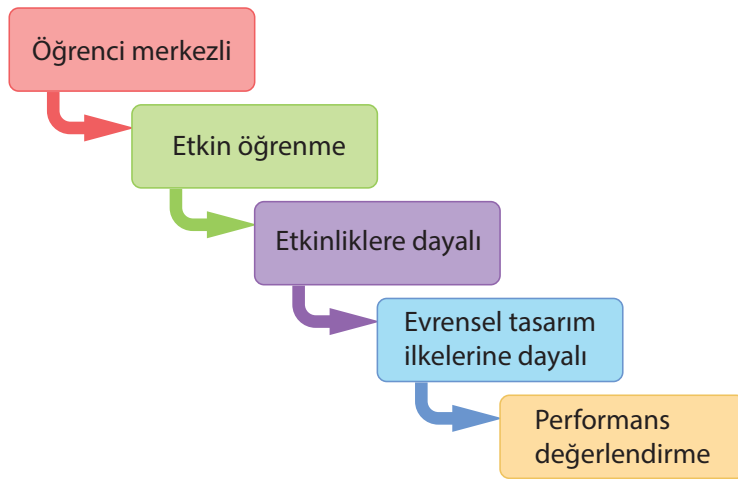
Şekil 1. Matematik Dersi ğretim Programının Kuramsal Dayanakları

Orta-ađır zihinsel engeli ve otizm spektrum bozukluđu olan ğrenciler için hazırlanan Matematik Dersi ğretim Programının kuramsal dayanakları: